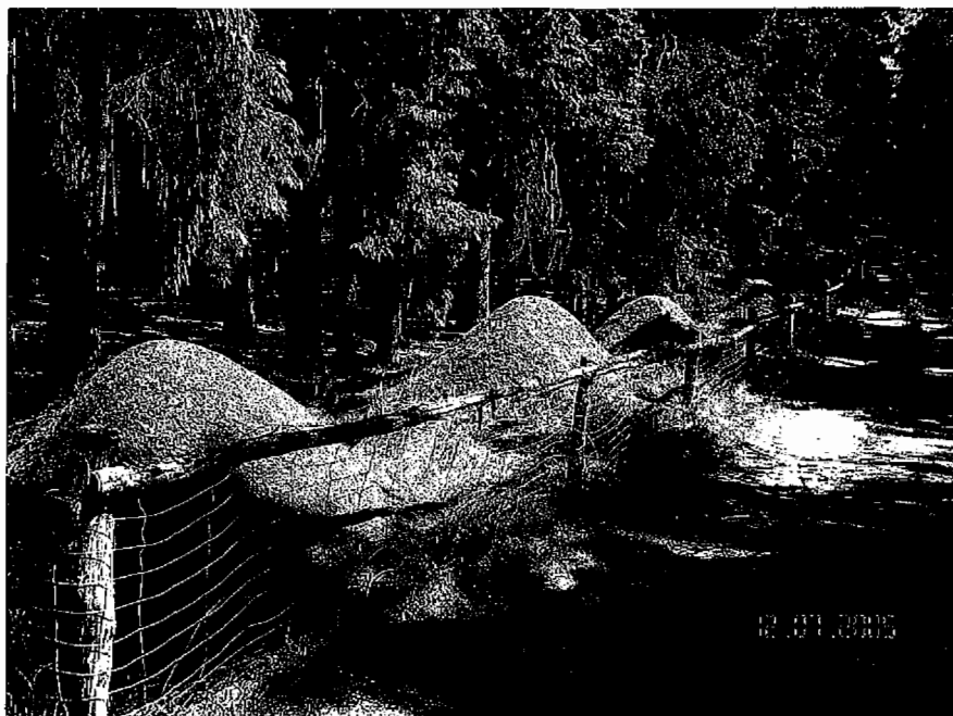
Kościernickie kolonie mrówki śmawej

Mrówki pełnią bardzo pożyteczną rolę w niszczeniu populacji wielu szkodliwych owadów. Mrówka, która jest drapieżnikiem jest istotnym czynnikiem hamującym masowe pojawianie się szkodników. W ciągu jednego dnia ofiarą jednego dużego mrówczego stada pada około 100.000 owadów, rocznie 5-10 mln owadów, zależnie od jakości siedliska i pogody w sezonie wegetacyjnym.