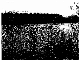
Jeziro Rakowe (zwane też Jeziorem Rekowym)

W Kościernicy na gruncie przekazanym przez Agencję Nieruchomości Rolnych powstaje piłkarskie boisko sportowe . W 2008r. wykonano prace ziemne oraz posiano trawę. Wiosną 2009r. zamontowane zostaną bramki.