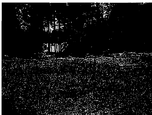
Szczyt świętej góry

Pomysłodawcą, mieszkańcem i gospodarzem pustelni jest o. Janusz Jędrzysek OFM Conv. Wchodząc na Świętą Górę mija się duże ok. dwumetrowe drewniane rzeźby-kapliczki przedstawiające Tajemnice Różańcowe oraz postaci świętych - wykonane przez rzeźbiarzy ludowych. W pobliżu można zauważyć przykryte ziemią ruiny dawniej istniejącej kaplicy.