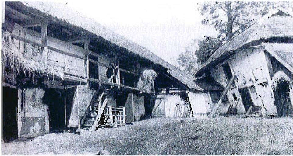
Karsina – zagroda dolnosaska od strony podwórka.