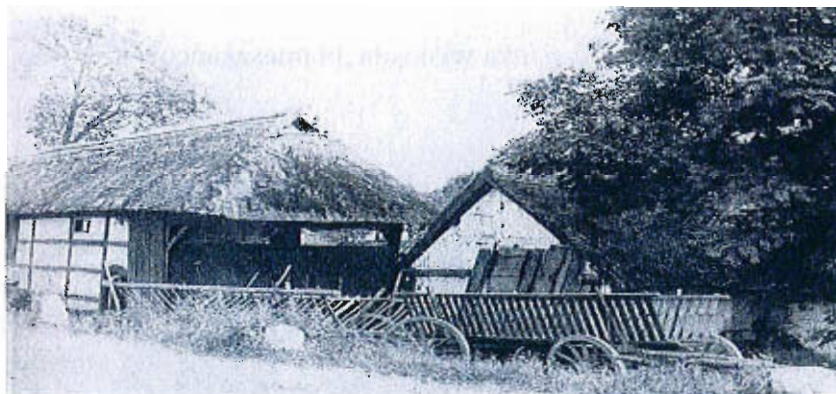
Karsina – zagroda dolnosaska od strony drogi