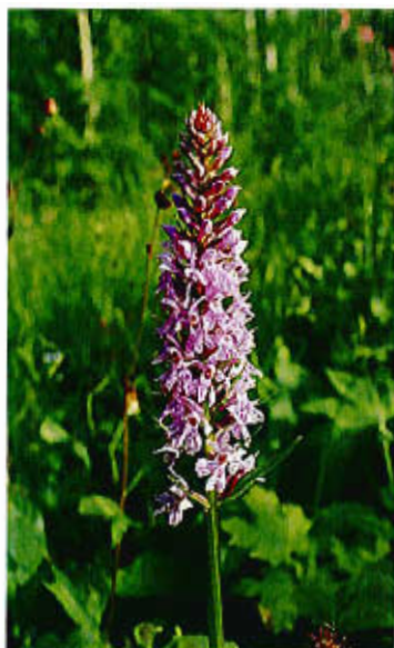
Storczyk Fuchsa występujący na Terenie Natura 2000 w Karsinie - narażony na wyginięcie