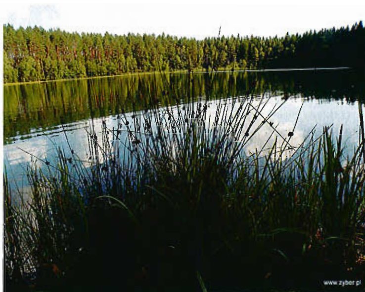
Jezioro Morskie Oko – lobeliowe, położone niedaleko od Karsiny