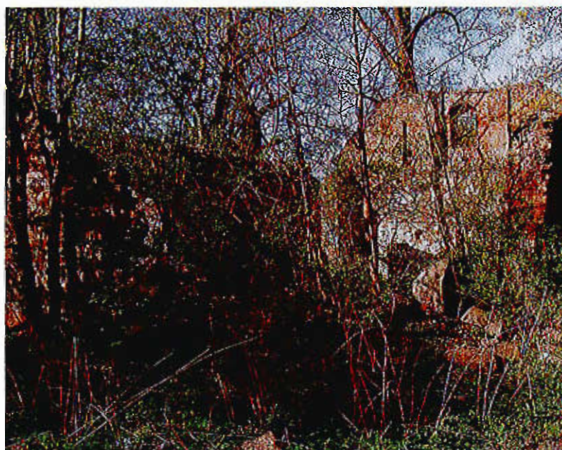
Ruiny Kościoła w Karsinie istniejącego już w wieku XIII, kościół jest rzadkim obiektem na terenie gminy Polanów, który posiada w ścianie zachowaną piscynę służącą dawniej do obmywania rąk w celach liturgicznych – objęty jest ochroną konserwatora zabytków