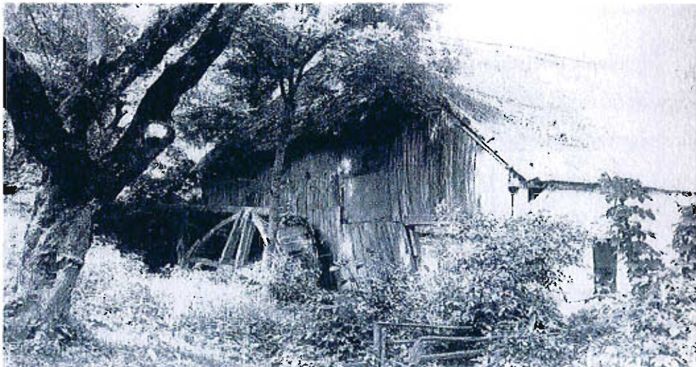
Karsina – młyn wodny.