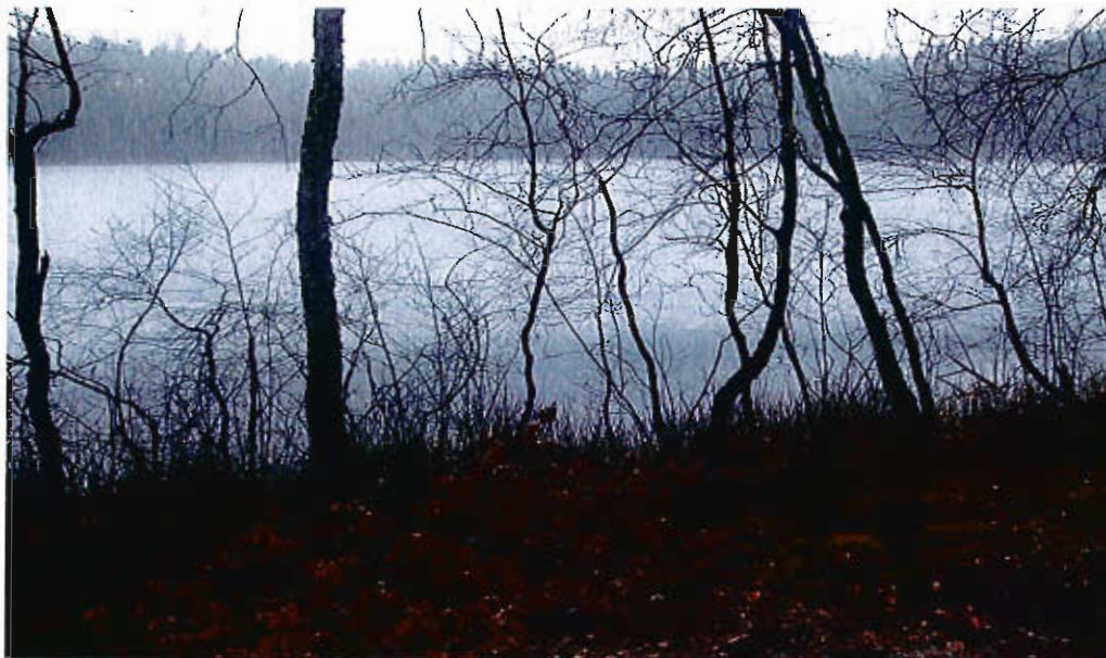
Jezioro Morskie Oko