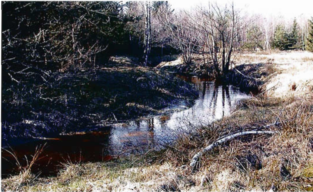
Puszcza Koszalińska wraz z przepływającą rzeką Mszanką