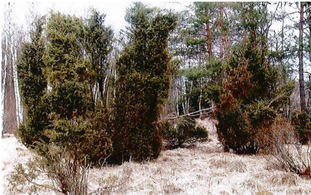
Przeszło 6 metrowe jałowce na obrzeżach Rekowa

Na powierzchni ok. 20 ha planowane jest utworzenie rezerwatu „Rekowski wrzosiec”. Rezerwat będzie się znajdował w ciągu tras rowerowych. Około 1 km od Rekowa znajdują się zbiorniki retencyjne, które zasilają wodą drzewostany, co wpływa korzystnie na walory krajobrazowe.