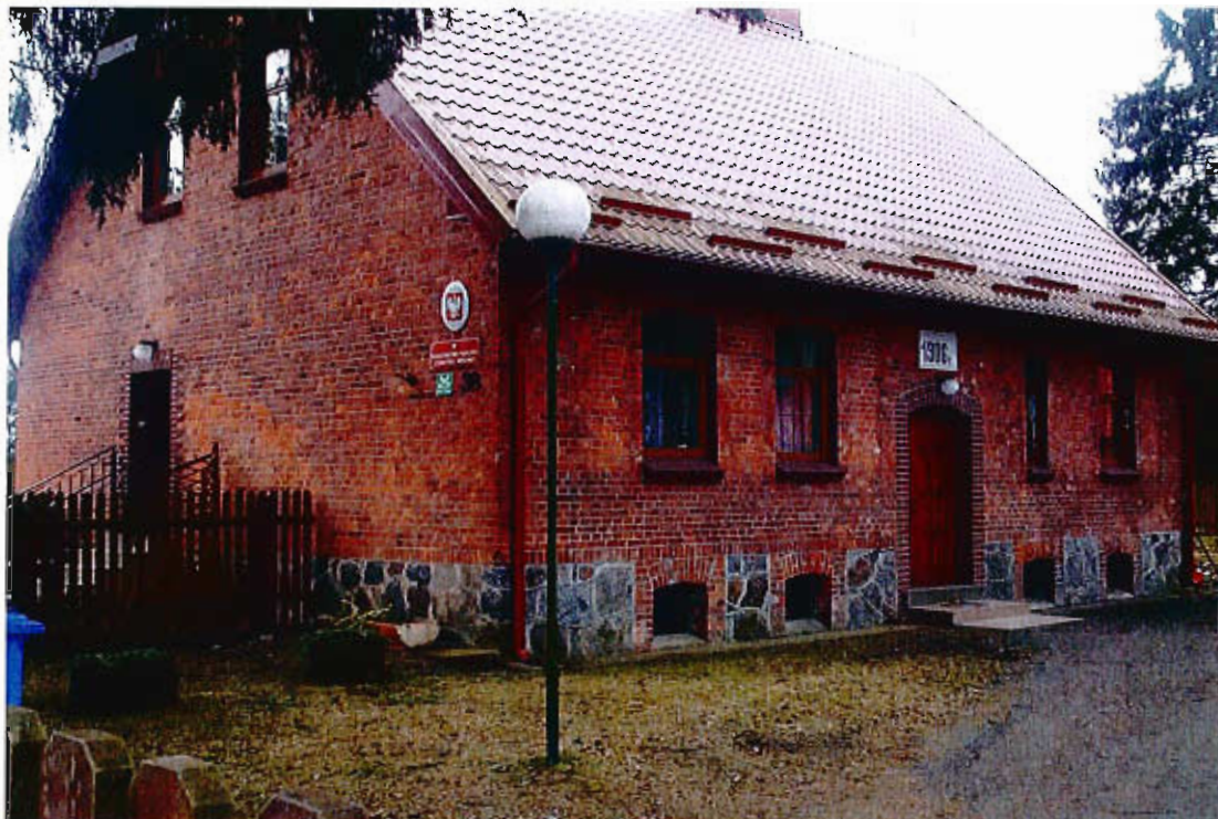
Budynek leśniczówki - z 1906r roku, który jest odremontowany i do dnia dzisiejszego pełni funkcję leśniczówki.