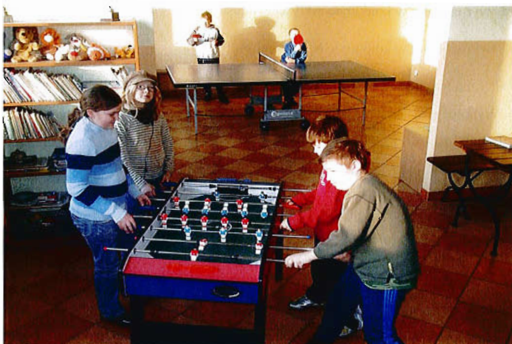
Codzienne gry i zabawy w świetlicy wiejskiej