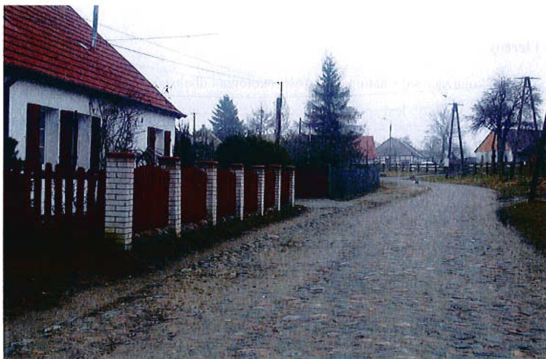
Wyremontowany dom z pierwszej połowy XX w. przy drodze brukowej

Odcinek drogi brukowej przechodzącej przez centrum wioski na długości 400m.