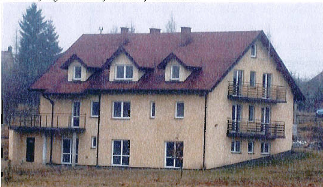
Pensjonat wybudowany w 2008 roku.