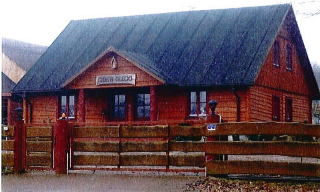
Dom w stylu góralskim wybudowany w 2006 roku.