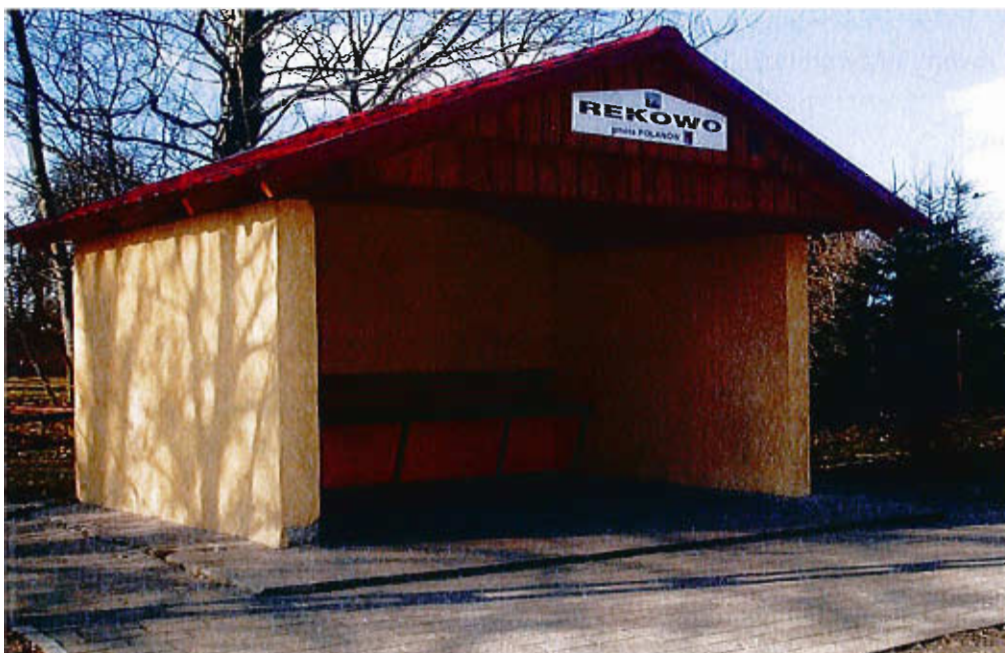
Przystanek wybudowany i zagospodarowany przez mieszkańców Rekowa