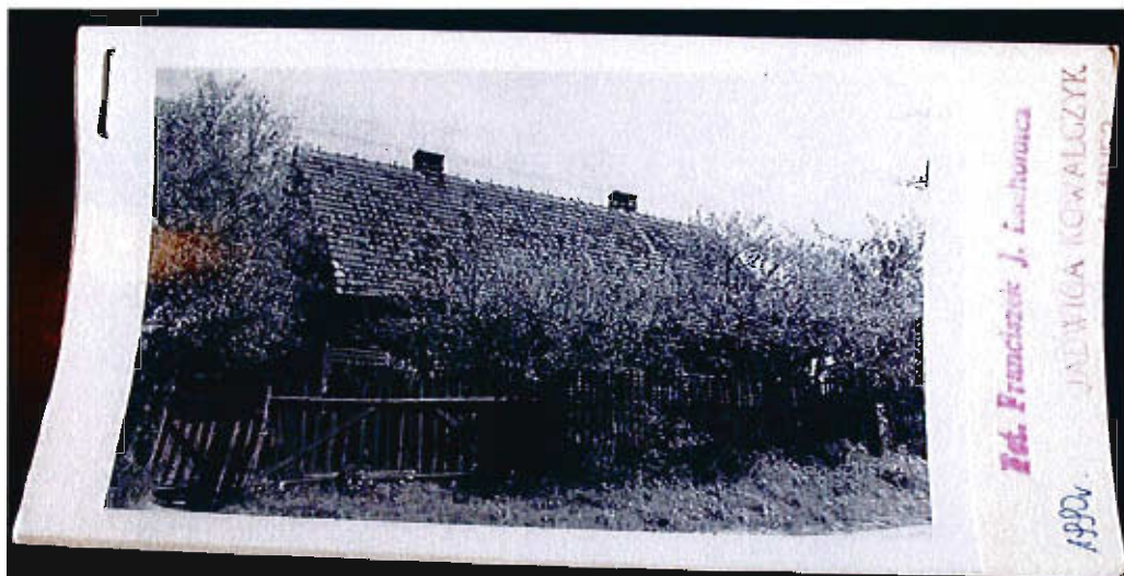
Budynek nr 5 w Rekowie, w którym po wojnie mieściło się Prezydium Gminnej Rady Narodowej.

Ówczesny budynek szkoły, w którym obecnie znajduje się świetlica wiejska i mieszkania gminne.