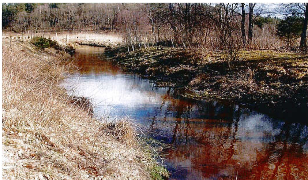
Rzeka Mszanka przepływająca przez Rekowo