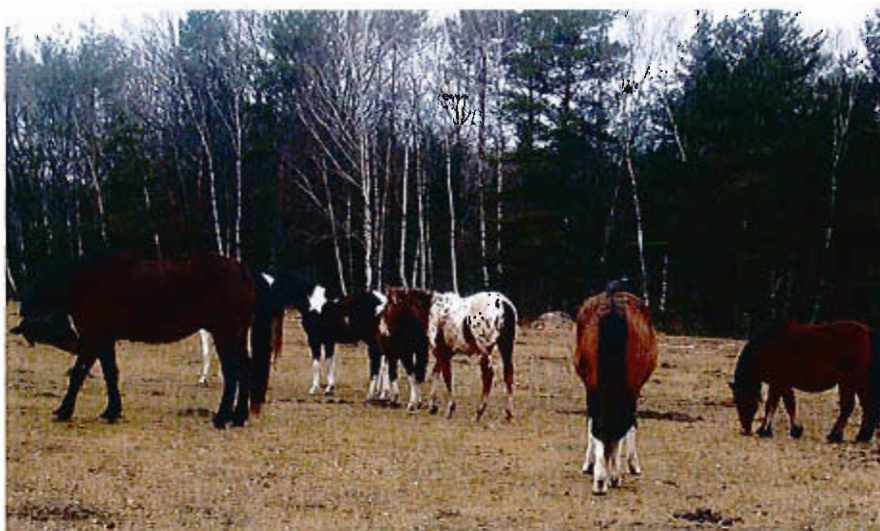
Stadnina koni agroturystyki NOBIS