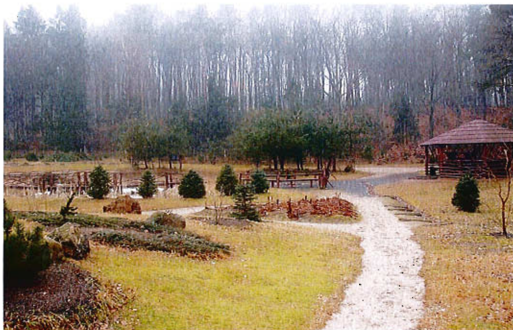
Park leśnika im. J. Łobodźca

Do Parku Leśnika prowadzi do kolonii mrówek prowadzi szlak rowerowy, drugi zaś z Rekowa do Sowinka, prowadzący wzdłuż torfowisk oraz projektowanego rezerwatu "Rekowski wrzosiec".