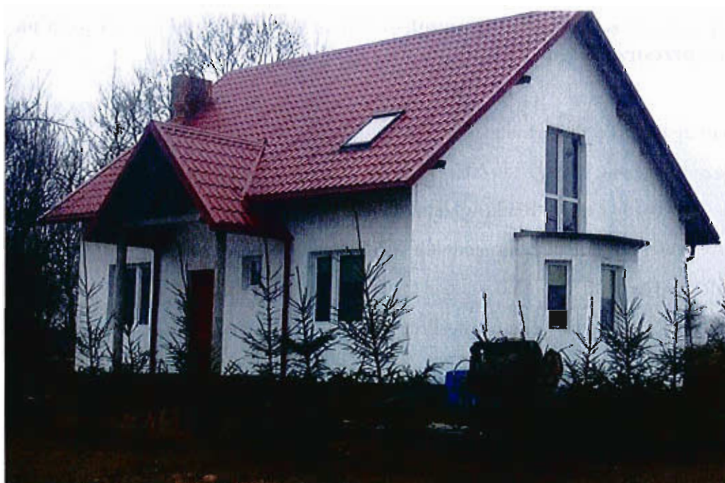
Dom wybudowany w 2008 roku.

c) Elementy charakterystyczne: W Rekowie jest 36 budynków mieszkalnych, a w Osetnie1, stara zabudowa z przed 1945 roku objęta ochroną konserwatorską. Elementem charakterystycznym jest droga brukowa oraz najstarszy budynek z roku 1906 – budynek leśniczówki.