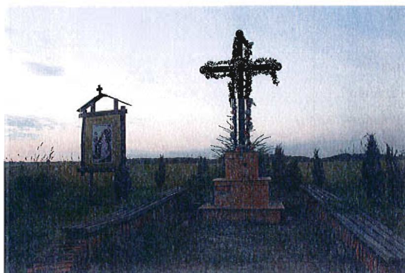
Kapliczka w Rososze