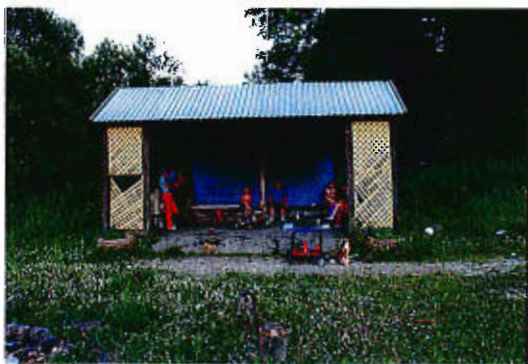
Wiaty w Rososze