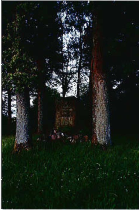
Pomnik poległych w I wojnie światowej