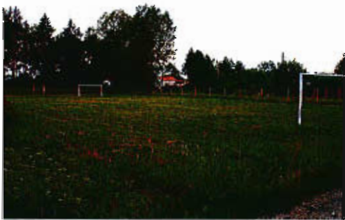
Boisko w Rososze

Na terenie miejscowości Rosocha funkcjonuje boisko sportowe zlokalizowane w centrum wsi (boisko do piłki nożnej i siatkowej wraz z wiatą), utworzone dzięki staraniom mieszkańców miejscowości i sponsorów. Życie społeczne miejscowości koncentruje się wokół boiska.