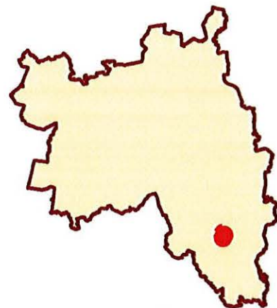
Mapa poglądowa: lokalizacja granic obszaru objętego planem na tle gminy Polanów