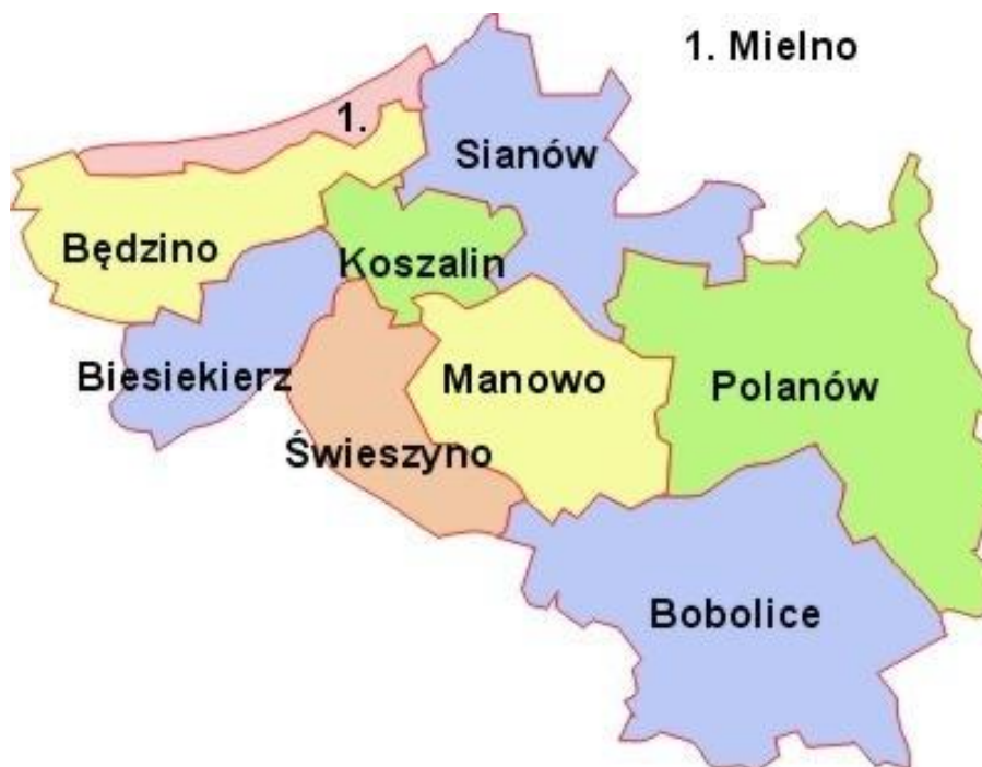
Rysunek 1 Gmina Polanów na mapie powiatu koszalińskiego

z gminą Miastko z powiatu bytowskiego (województwo pomorskie) i gminą Kępice z powiatu słupskiego (województwo pomorskie).