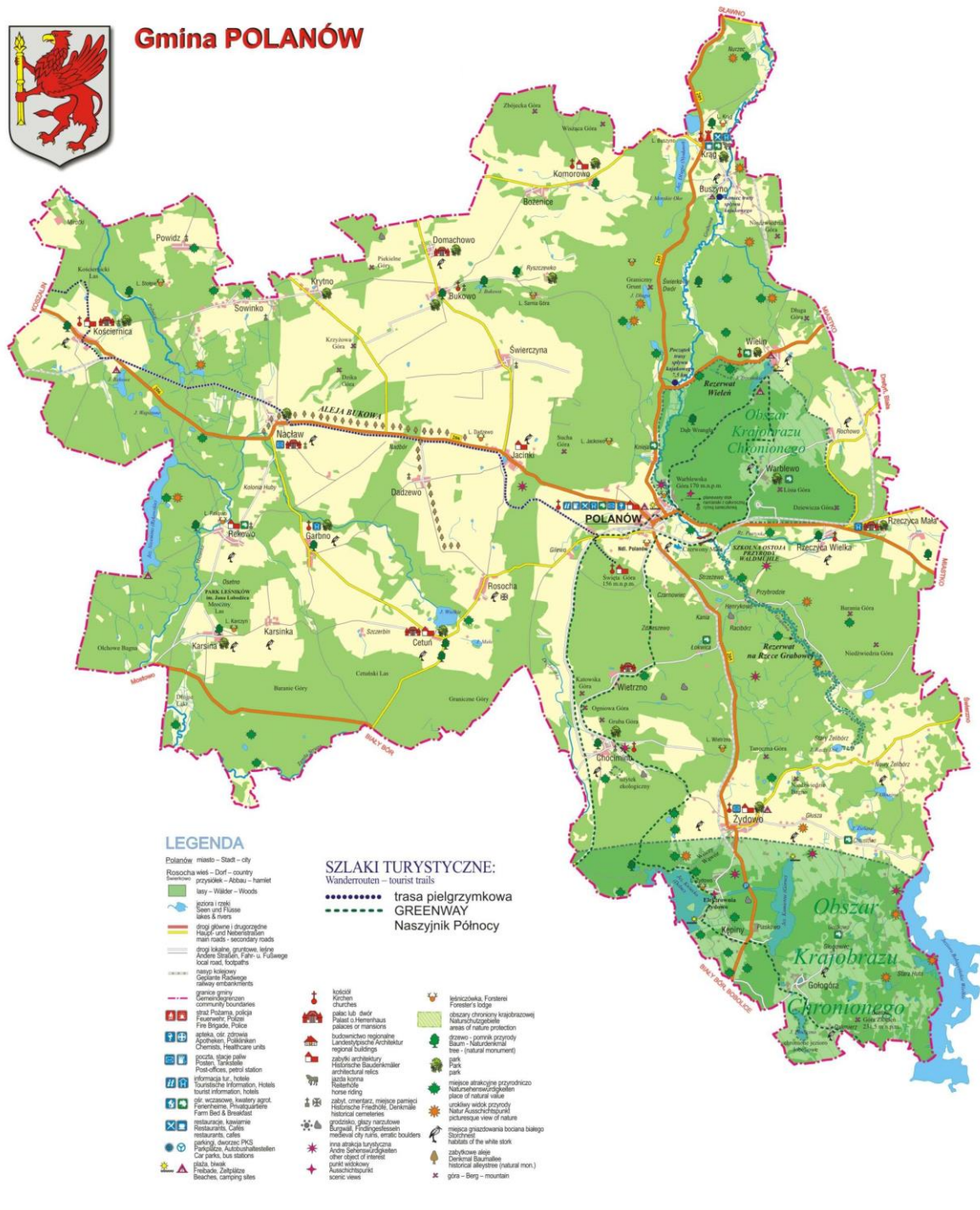
Rysunek 2 Mapa gminy Polanów

Sieć osadniczą Gminy Polanów tworzy miasto Polanów i 73 zamieszkałe miejscowości położone na obszarze 28 sołectw. Przedstawia je poniższa tabela.