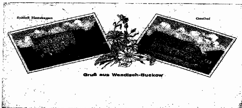
BUKOWO ok. 1925. - Pałac w Domachowie i gospoda. WENDISCH BUCKOW ok. 1925. - Schloße in Hanshagen und Gasthof.