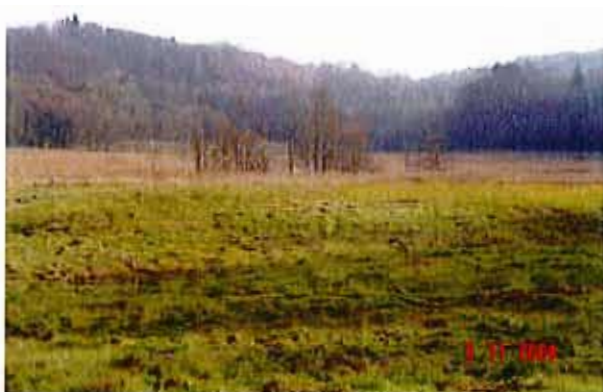
Torfowisko „bagno Wietrzno”

z trzcina i ziołoroślinami w runie. Od północy i wschodu dolinę obramowują wysokie zbocza porośnięte starodrzewem bukowym.