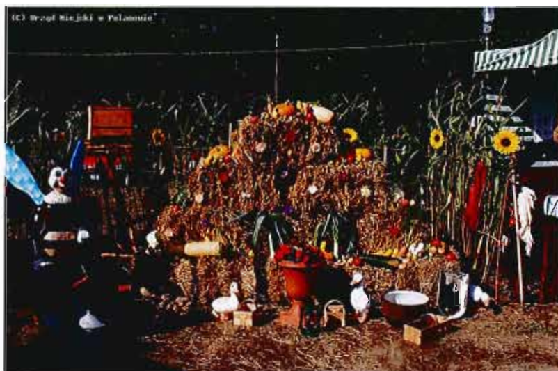
Dożynki 2007 r.

W 2007 roku sołectwo Chocimino wraz z sołectwem Wietrzno organizowało „Gminne Dożynki” we Wietrznie.