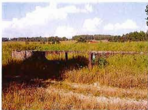
Ruiny stacji kolejowej

budynek gospodarczy murowany , II połowa XIX wieku. Bazę kolejową . Ślady torowiska oraz kamienne wiadukty.